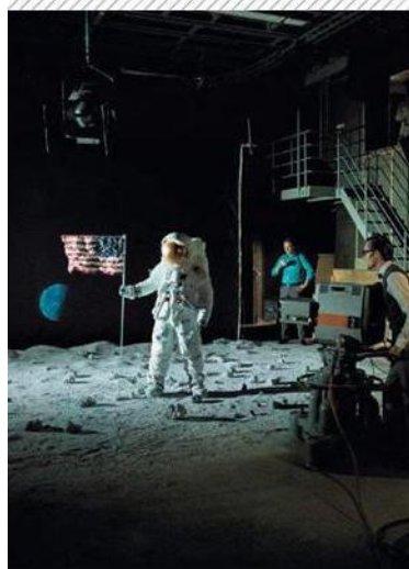
Dalla mostra su complotto e fake news in Statale

Filosofia avviato quattro anni fa, in battuta d'arresto con la pandemia e ora di nuovo a gonfie vele, la mostra ricuce alla filosofia la psicologia, scienze sociali, storia e letteratura. Una videogallery di cartoni animati e di interventi in pillole di esperti, ma anche una collezione di cruciverba, rebus e anagrammi, fanno riflettere sulle Bias (scorciatoie cognitive) e altri inganni della psiche che ci inducono a credere a storie prive di fondamento, complice forse l'illusione di sentirci un po'